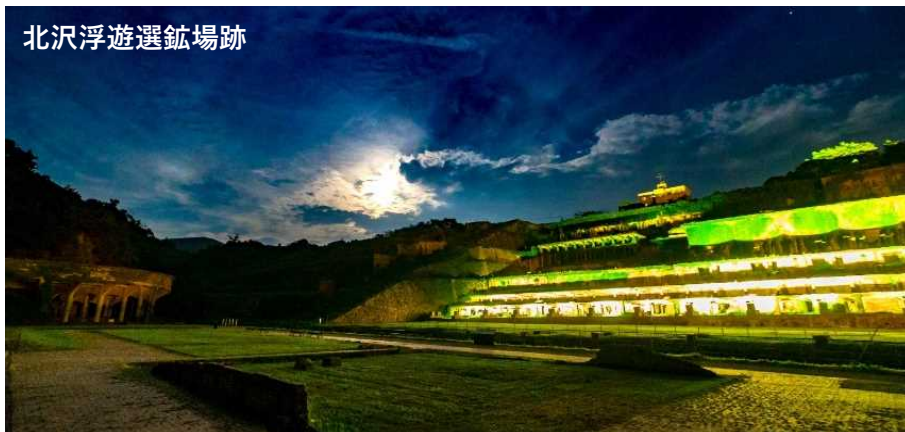
北沢浮遊選鉱場跡