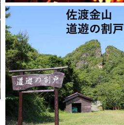
佐渡金山 道遊の割戸

新潟のプレミア情報を全国に、 世界に自慢するお手伝いと一緒にお願いします。 表参道・新潟館ネスパスで。