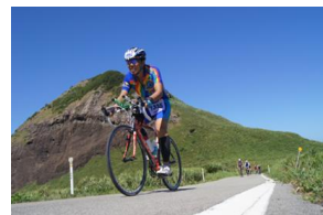
佐渡ロングライド