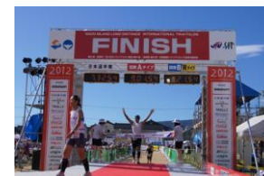
佐渡国際トライアスロン