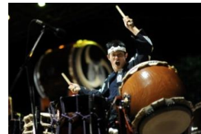
アースセレブレーション